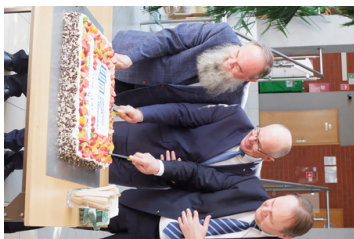
Zdjęcia OUM w Białymstoku