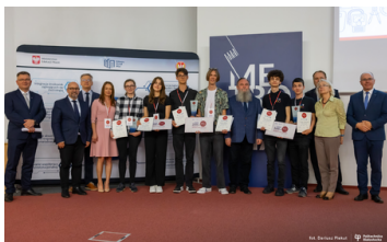
Zdjęcia OUM w Białymstoku